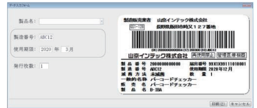
印刷指示画面イメージ