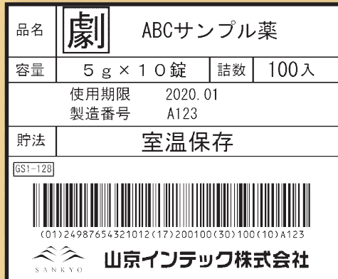
グレードAのラベル