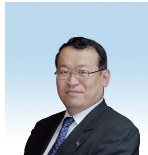
飯田市長 牧野 光朗