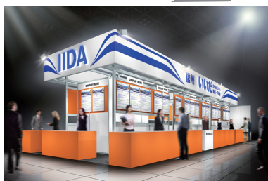
飯田・下伊那ブース位置 小間番号東5ホール NO.42-22